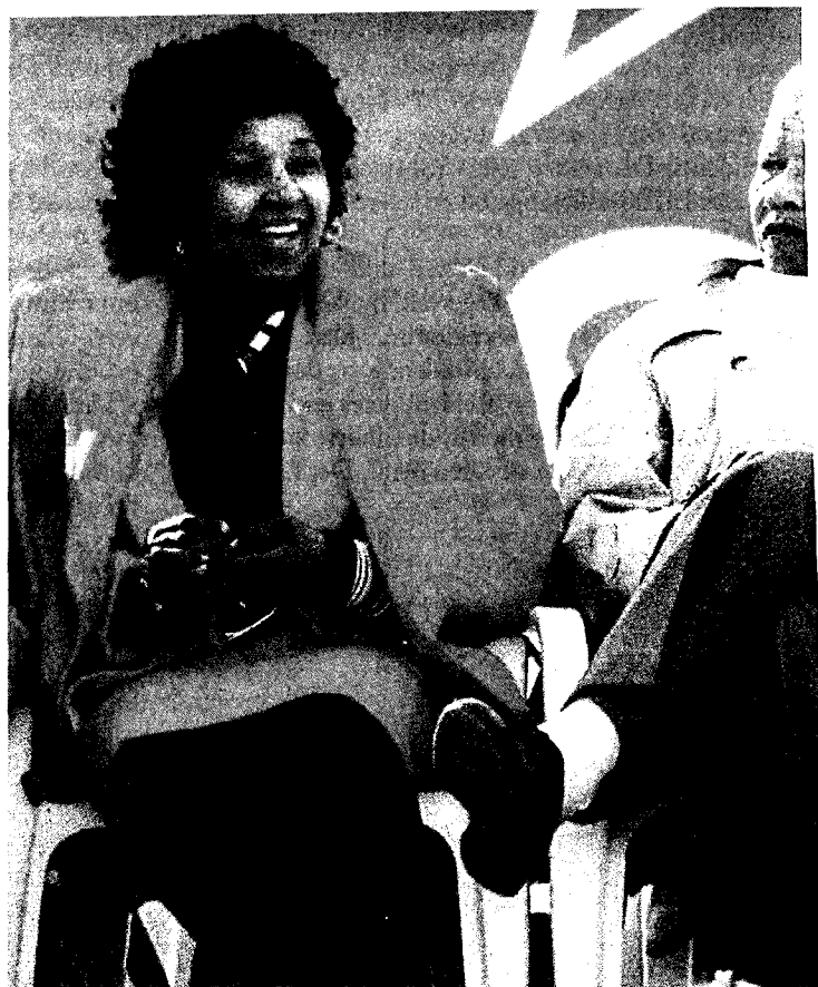
Præsident Nelson Mandela, hans daværende hustru Winnie Mandela (til højre) på det stiftende møde i det nu lovlige kommunistparti den 29. juli 1990 i